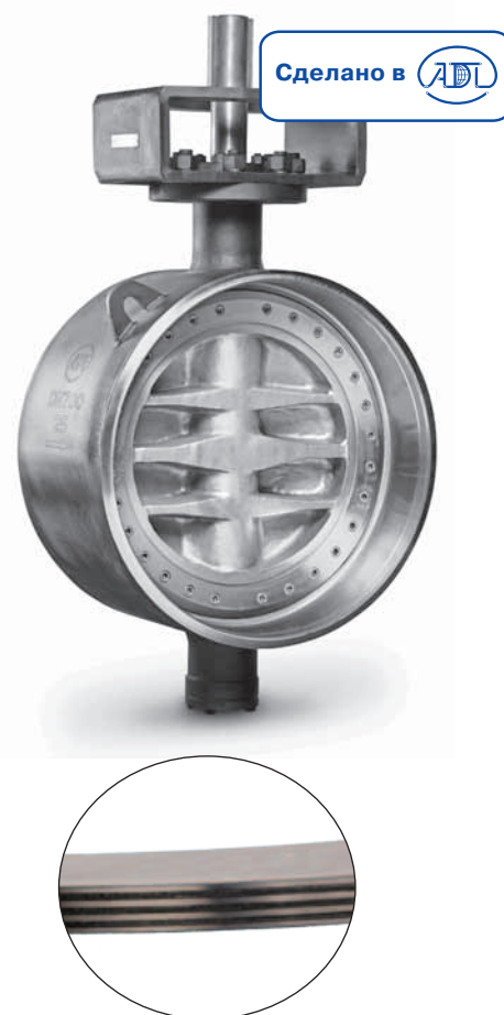
Наборное уплотнение «металл/графит»

Затвор имеет герметичность класса «А» в обоих направлениях потока!